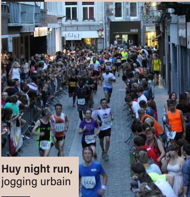
Huy night run, jogging urbain