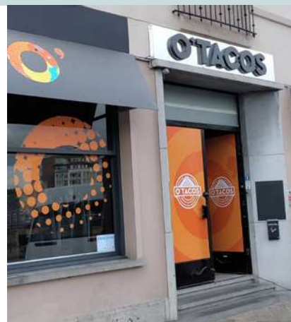
NEW ! O'Tacos French tacos Quai Dautrebande, 8