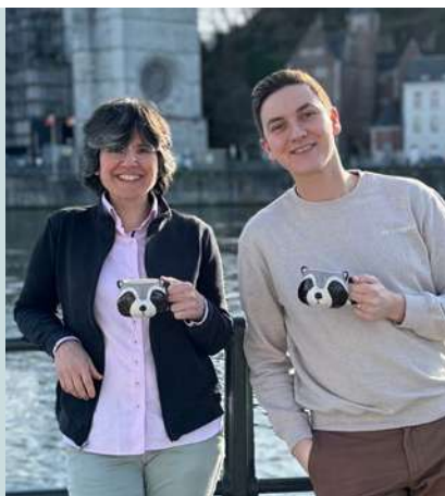
NEW ! Raccoon communication. Agence marketing 360° Rue de la Résistance, 11/RC06