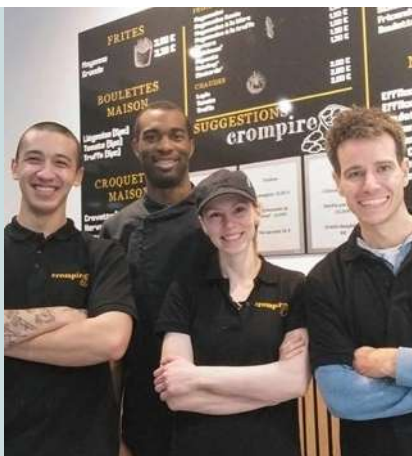
NEW ! Cromptire Snack belge responsable & bio Rue Joseph Wauters, 38