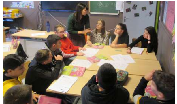
Classe de 6 e primaire