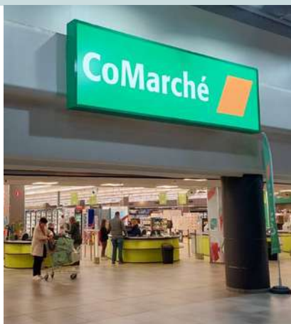
NEW ! CoMarché Supermarché de proximité Avenue de Batta, 10