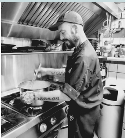
NEW ! La cuisine de Jona Friterie/snack, bar à cocktails/tapas Chaussée de Waremme, 141