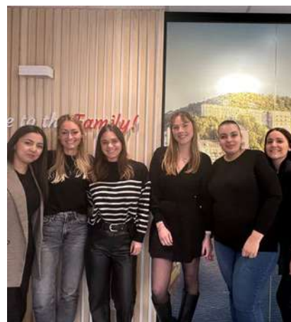
Déménagé ! JobCenter Daoust Agence d'intérim et de titres-services Avenue Delchambre, 14 b