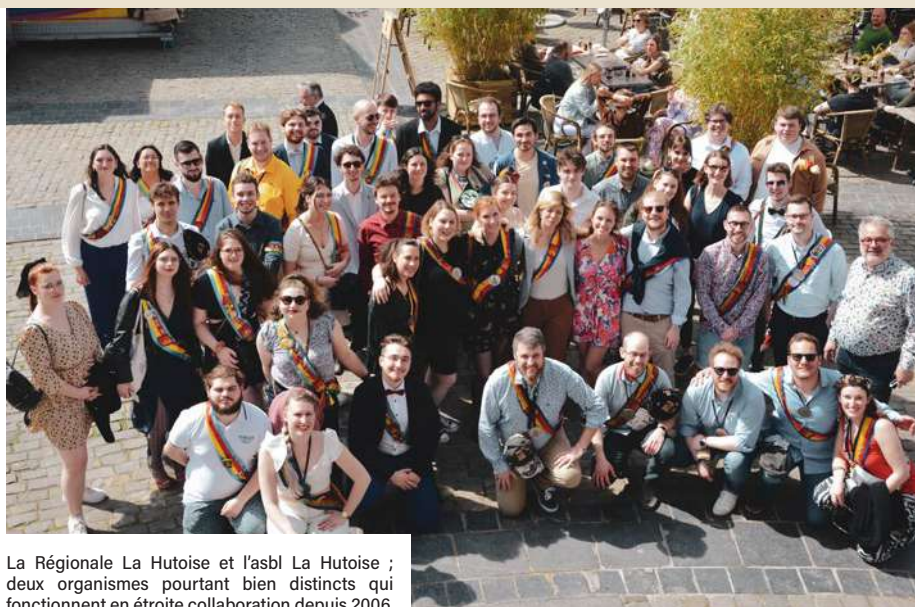
La Régionale La Hutoise et l'asbl La Hutoise ; deux organismes pourtant bien distincts qui fonctionnent en étroite collaboration depuis 2006.

📄 Découvrez le texte complet de la motion ici : www.huy.be/actualites/huy-ville-anti-fasciste