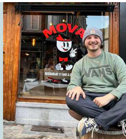
NEW ! Mova Cuisine gourmande, cocktails En Mounie, 2