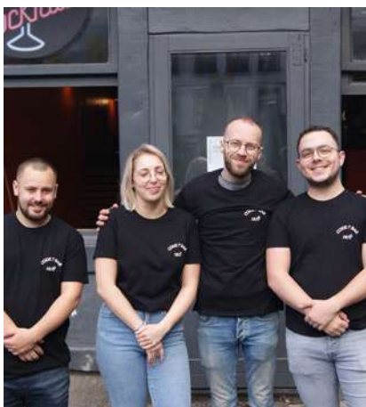
Reprise ! Code 7 Bar Bar, musique, bar à cocktails Grand-Place, 6