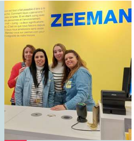
NEW ! Zeeman Vêtements, linge de maison... Avenue du Bosquet, 41