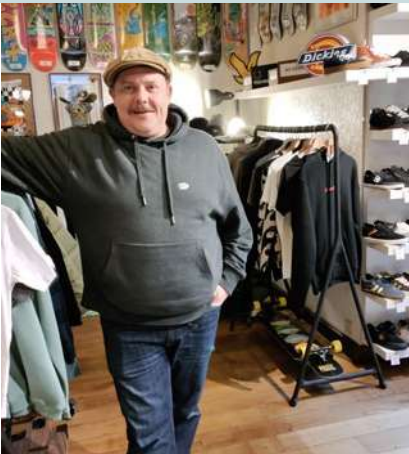
DÉMÉNAGEMENT ! Park Life Sports de glisse, streetwear, streetart... Rue des Fourages, 6