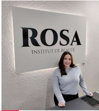
NEW ! Rosa Institut de beauté Rue des Fouarges, 6