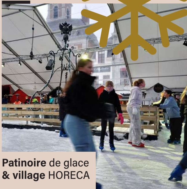
Patinoire de glace & village HORECA