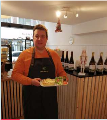
NEW ! Joe's cookers Tartes et quiches artisanales Rue Sous-le-Château, 4