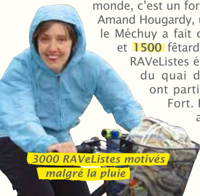
3000 RAVeListes motivés malgré la pluie