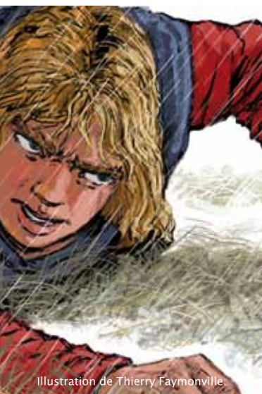
Illustration de Thierry Faymonville.