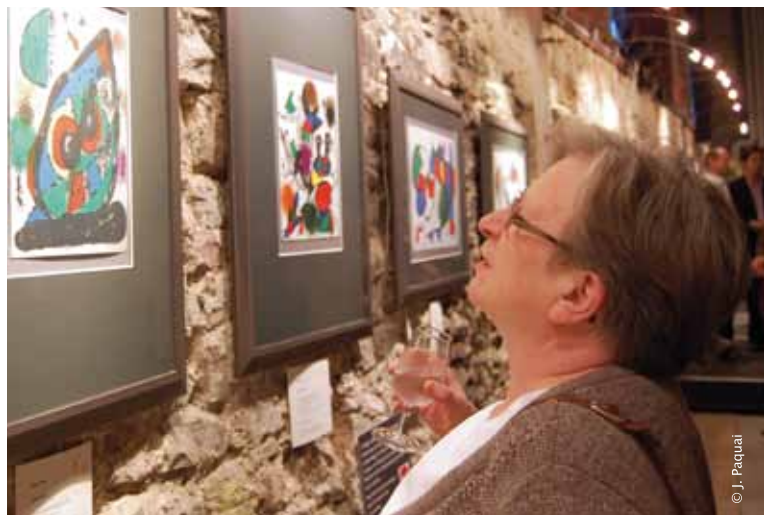
80 lithographies de Miró à découvrir à l'Espace Saint-Mengold jusqu'au 15 août.