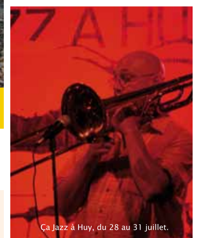
Ça Jazz à Huy, du 28 au 31 juillet.

Dolly Two Dollars, à la Fête de la musique le 17 juin.