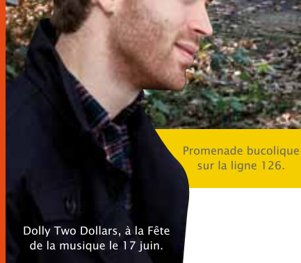
Promenade bucolique sur la ligne 126.

Dolly Two Dollars, à la Fête de la musique le 17 juin.