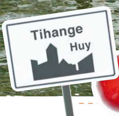
Frédéric Warzée et ses potes givois sont prêts à faire la fête. Et vous?