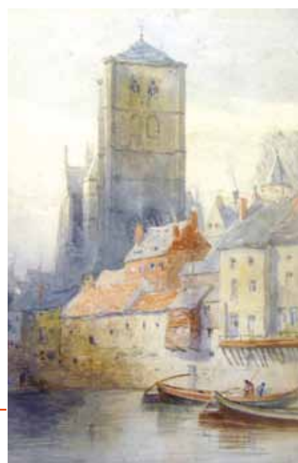
Dessin original d'Ernest George réalisé en 1875.

Infos > L'exposition «Du roman Le passeur de lumière de Bernard Tirtiaux illustré par Thierry Faymonville au gothique dans la B.D. (reproductions de planches de B.D.)» sera visible à la collégiale Notre-Dame de Huy du 2 juillet au 11 septembre. Du mardi au dimanche de 9h à 12h et de 14h à 17h. Entrée gratuite. Tél. 0479.84 57 89.