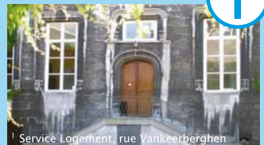
1 Service Logement, rue Vankeerberghen