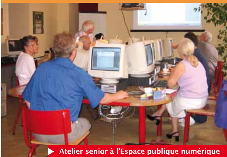
► Atelier senior à l'Espace publique numérique

Avec près de 3000 nouvelles acquisitions par an, la Bibliothèque reste votre partenaire privilégié pour découvrir romans, livres documentaires récents, bandes dessinées de qualité et même ouvrages en grands caractères. En salle de lecture, plus de 100 titres de revues, journaux et périodiques ainsi que des dossiers de presse peuvent être consultés. La Bibliothèque propose aussi le prêt d'audiolivres, de DVD documentaires ou la consultation en ligne de la célèbre Encyclopédie Universalis.